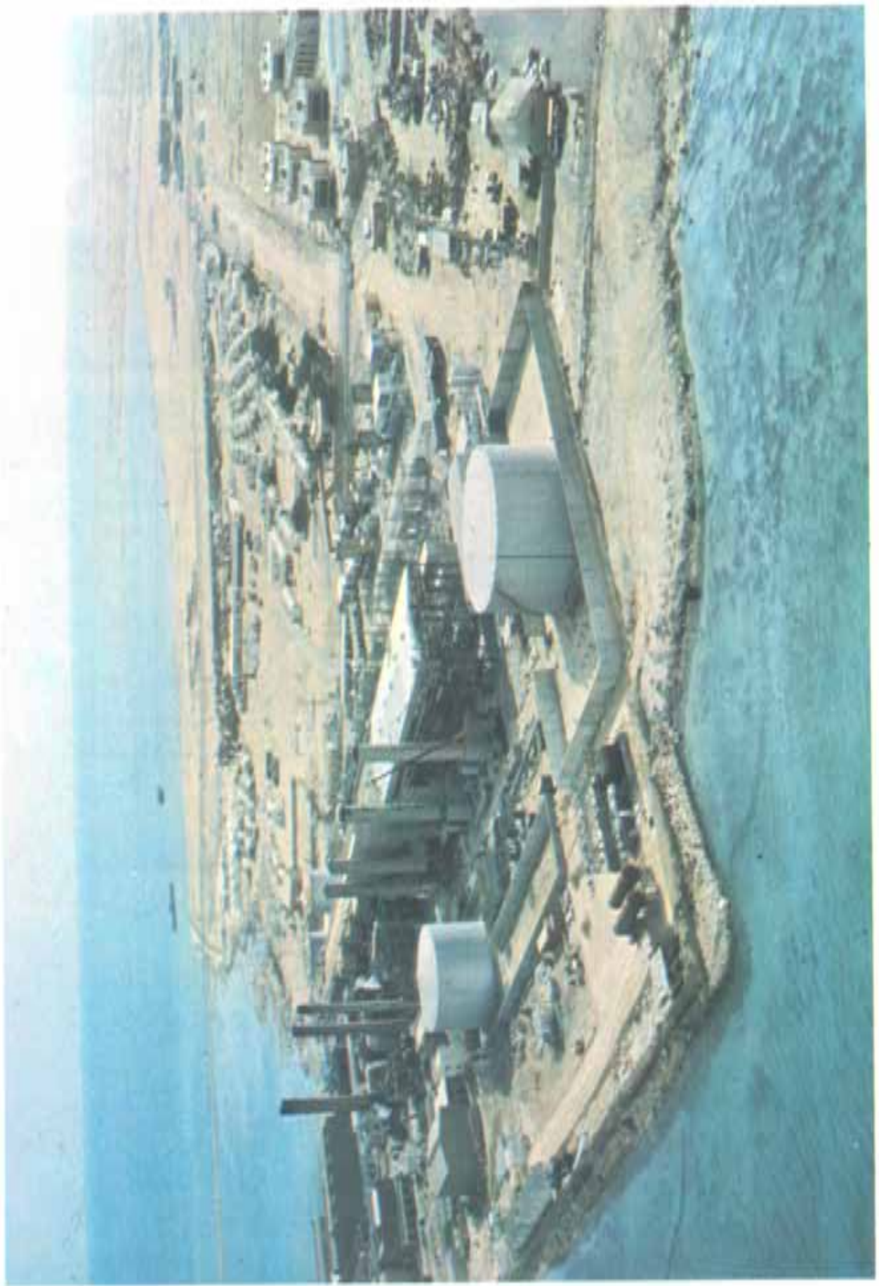
محطة الكهرباء وتطية مياه البحر بمرسى أبو قنطاس