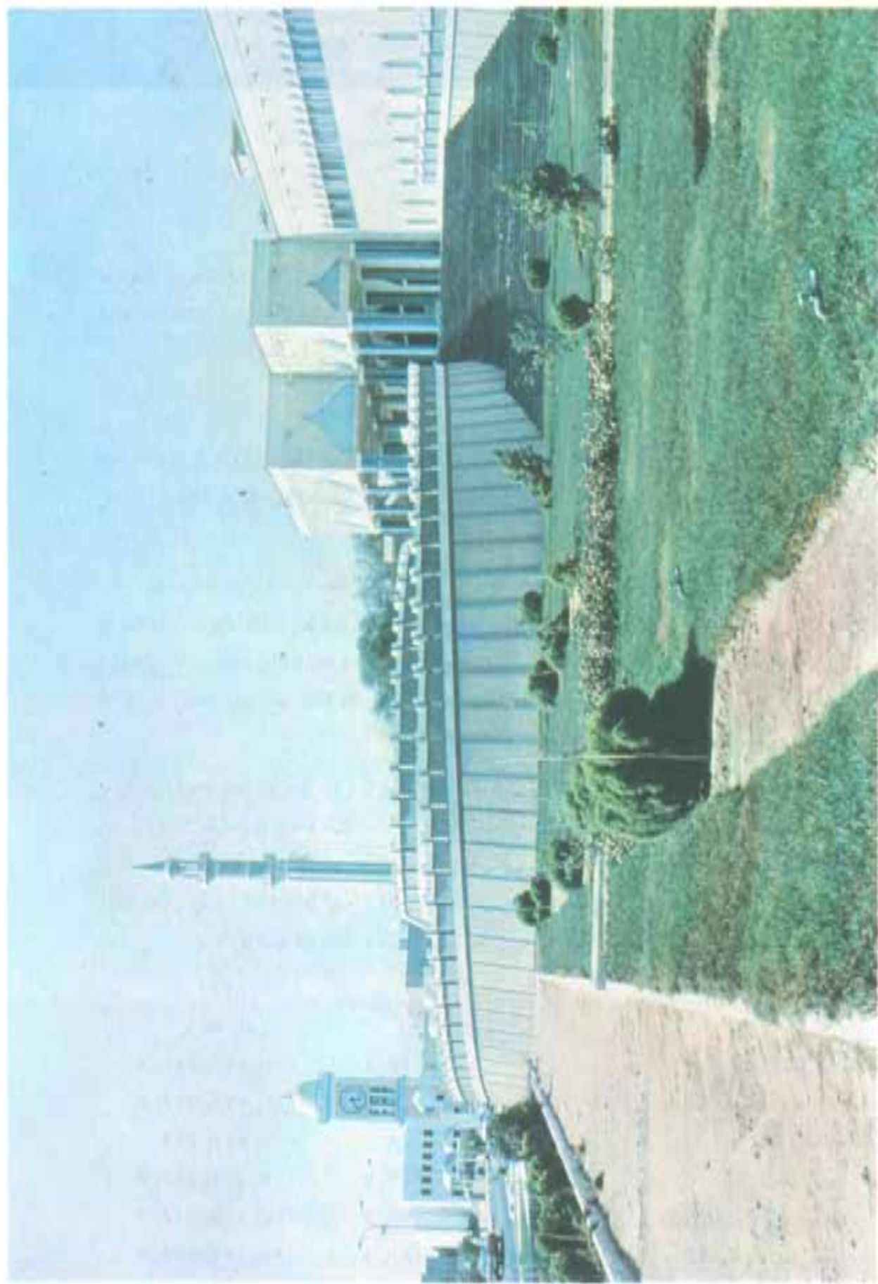
قصر الفوحة و برج الساعة والجامع الكبير