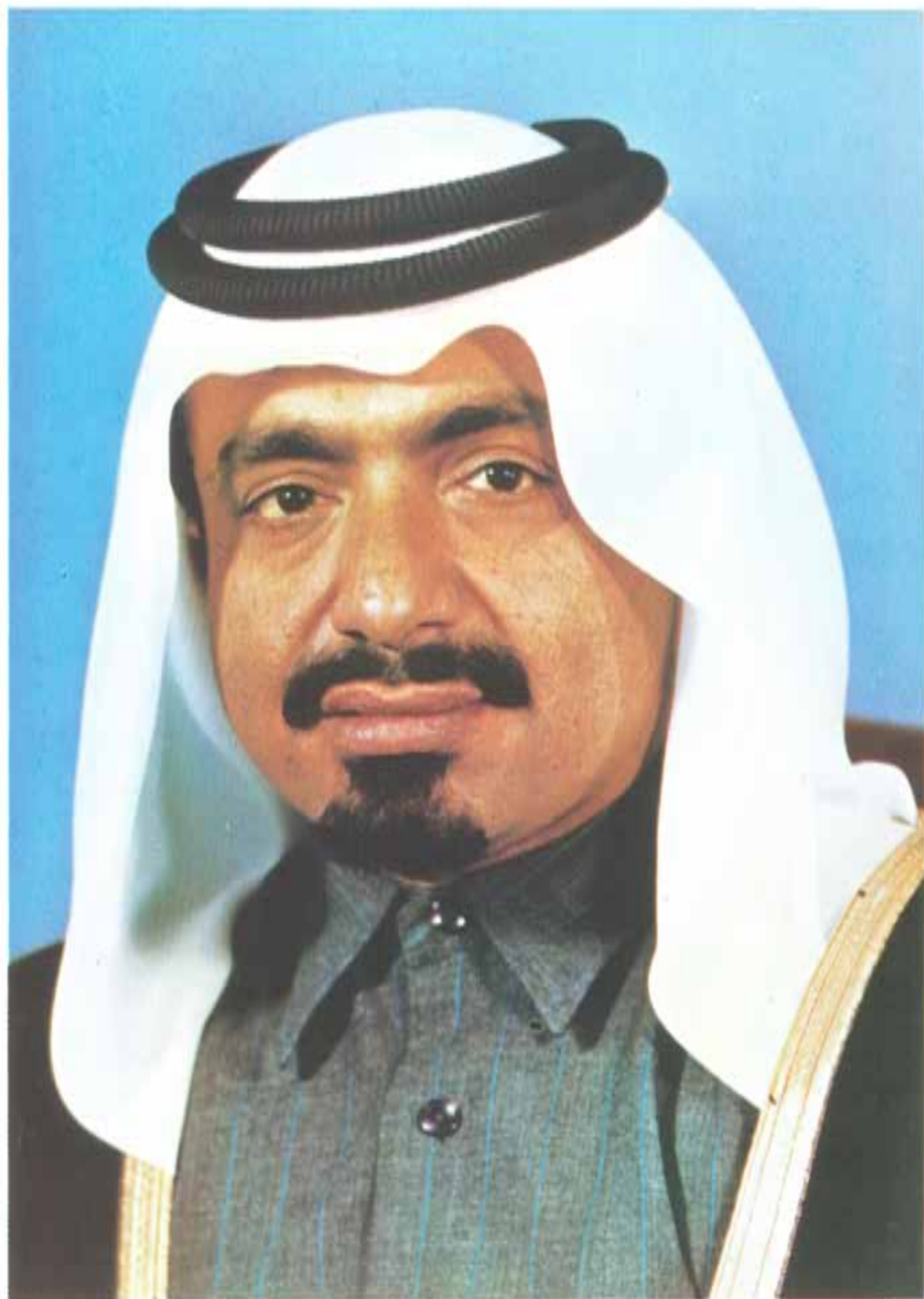
حضرة و عهده الشيخ السيمون خليفة بن محمد آل تازان أمير دولة قطر