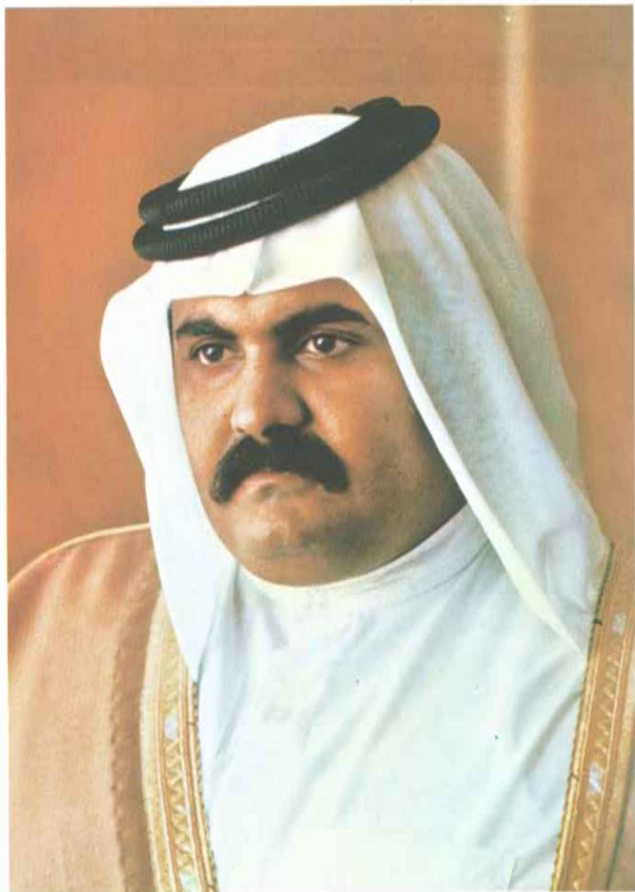
فارس البعور الشيخ حمزة بن خليفة بن محمد الثاني ولى العهد ووزير الدفاع